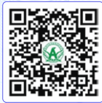
深圳安防协会官方微信