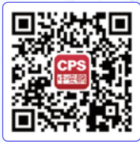
CPS 中安网 APP

本报告呈现的信息由公开资料以及企业走访整理而成。深安协、CPS 中安网对信息的时效性、准确性、完整性尽最大程度追求，但不作任何保证。本报告所呈现的资料、意见、观点及推测，仅反映在报告发布当日之前的判断，不保证本报告所含信息保持在最新状态；同时，本报告仅以提供信息为目的而发布，并不因为收件人接受本报告而视其为客户，在任何情况下本报告中的信息以及所表述意见均不对任何机构及个人构成任何投资、决策建议。