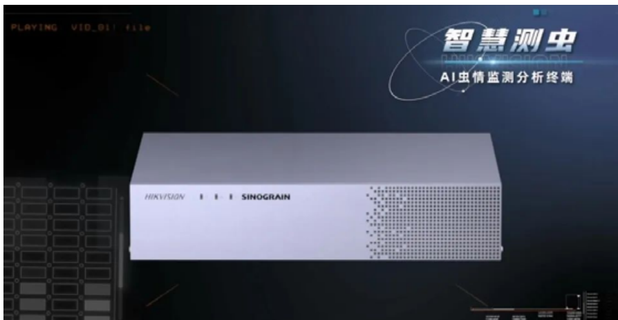
AI 虫情监测分析终端