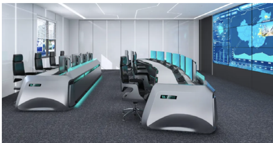
智能车辆识别与精细化管理系统

此外，Cyber 控制台还采用了灵活的模块化设计，这一设计理念使得用户可以根据实际需求自由组合和扩展功能模块。无论是交通、应急、医疗还是其他领域，Cyber 控制台都能满足不同场景下的应用需求，为用户提供了极大的便利性和灵活性。